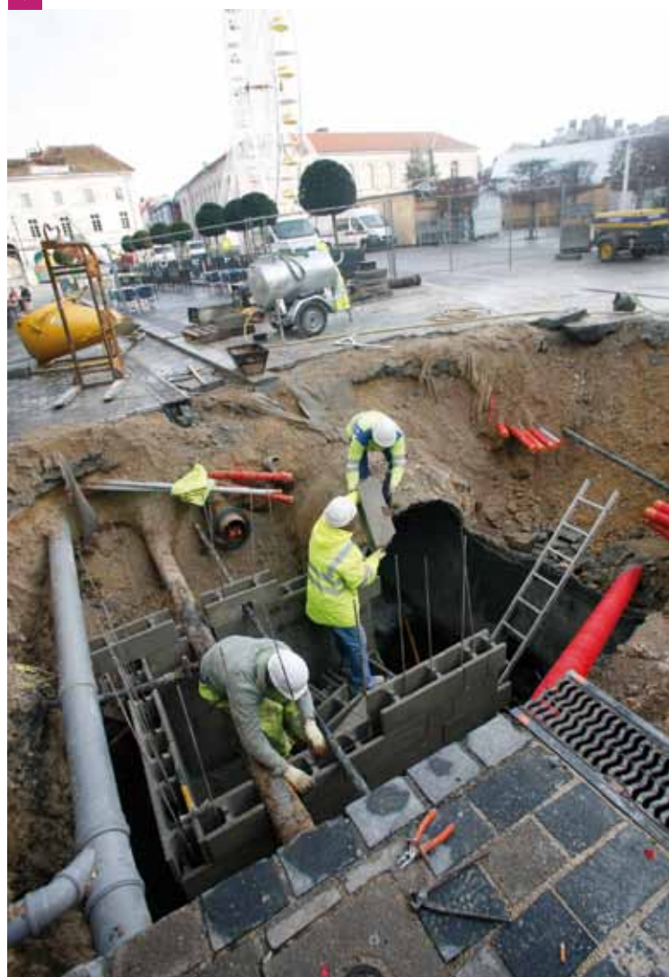
PLACE DE LA RÉVOLUTION, LES TRAVAUX ONT FAIT BON MÉNAGE AVEC LE MARCHÉ DE NOËL ET LA GRANDE RUE. ▼

Pont-de-Gaulle : alors que les études d'exécution se poursuivent, le pont, en décembre, a été l'objet de multiples interventions : enlèvement du trottoir côté Canot, déviation d'une ligne haute tension, des lignes France Telecom et éclairage public, rabotage de la chaussée sur les 2/3 du tablier afin de mettre à nu la dalle supérieure de l'ouvrage avant de la refaire et d'en assurer l'étanchéité. Etalées sur décembre et janvier, sont également programmées les premières réparations à l'intérieur de la structure (carottages, piquages béton, scellement acier...), ainsi que la construction d'une longrine (poutre en béton) de 170 m de long, 30 cm de largeur et 8 cm de hauteur, tout le long du trottoir disparu. Une fois réalisée, cette longrine permettra la pose de garde-corps et de candélabres. Si les intempéries ne viennent pas bousculer le calendrier, les travaux portant sur la partie extérieure du pont devraient être terminés fin avril, et ceux à l'intérieur se prolonger un peu jusqu'au passage de relais avec l'Agglo, maître d'ouvrage du chantier de plateformage.