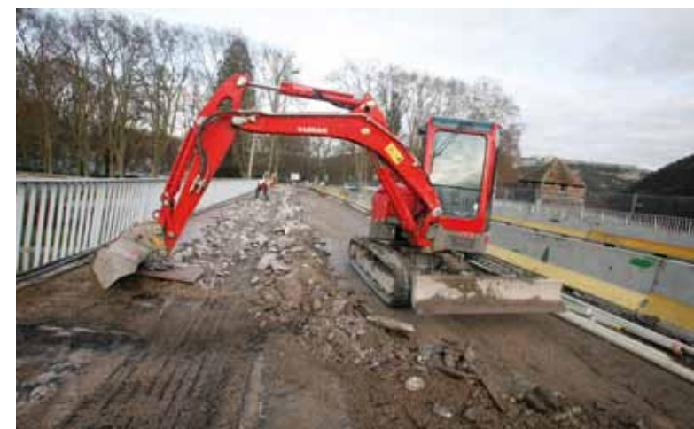
▲ CÔTÉ AMONT, LE TROTTOIR A DISPARU.

Pont-de-Gaulle : alors que les études d'exécution se poursuivent, le pont, en décembre, a été l'objet de multiples interventions : enlèvement du trottoir côté Canot, déviation d'une ligne haute tension, des lignes France Telecom et éclairage public, rabotage de la chaussée sur les 2/3 du tablier afin de mettre à nu la dalle supérieure de l'ouvrage avant de la refaire et d'en assurer l'étanchéité. Etalées sur décembre et janvier, sont également programmées les premières réparations à l'intérieur de la structure (carottages, piquages béton, scellement acier...), ainsi que la construction d'une longrine (poutre en béton) de 170 m de long, 30 cm de largeur et 8 cm de hauteur, tout le long du trottoir disparu. Une fois réalisée, cette longrine permettra la pose de garde-corps et de candélabres. Si les intempéries ne viennent pas bousculer le calendrier, les travaux portant sur la partie extérieure du pont devraient être terminés fin avril, et ceux à l'intérieur se prolonger un peu jusqu'au passage de relais avec l'Agglo, maître d'ouvrage du chantier de plateformage.