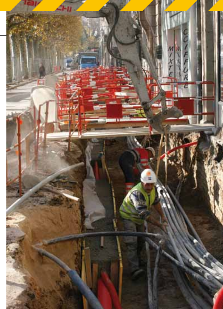
▲ TOUTE LA COMPLEXITÉ DU CHANTIER DU QUAI VEIL-PICARD RÉSUMÉE EN UNE SEULE PHOTO.

Piémont : calendrier parfaitement respecté pour ce chantier étalé sur cinq mois qui a connu une intense activité en juillet-août. Il a fallu d'abord poser un collecteur d'assainissement de 60 m de long et de 1,40 m de diamètre sous le pont de la rue de Dole, puis construire deux chambres de raccordement de chaque côté pour le relier à l'existant et en faciliter l'accès. De même, de nouvelles canalisations destinées à accueillir le gaz, l'eau, la fibre optique et France Telecom se sont substituées aux anciennes sur une centaine de mètres.