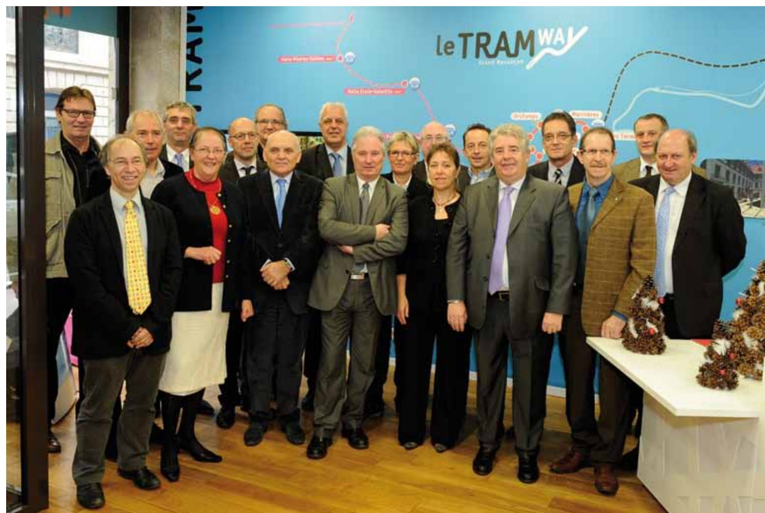
A UTOUR DE JEAN-LOUIS FOUSSERET À LA MAISON DU TRAM, LES SIGNATAIRES SOURIANES DE LA « CHARTRE EMPLOI TRAMWAY » DONT PLUSIEURS VICE-PRÉSIDENTS DE L'AGGLO, LE SECRÉTAIRE GÉNÉRAL DE LA PRÉFECTURE, LE PRÉSIDENT DU CONSEIL GÉNÉRAL, LE REPRÉSENTANT DU CONSEIL RÉGIONAL, LA REPRÉSENTANTE DE LA VILLE, LE PRÉSIDENT DE LA FÉDÉRATION RÉGIONALE DES TRAVAUX PUBLICS, LE PRÉSIDENT DE LA CHAMBRE DE COMMERCE ET D'INDUSTRIE, LE PRÉSIDENT DE LA CHAMBRE DES MÉTIERS ET DE L'ARTISANAT, LES REPRÉSENTANTS DE PÔLE EMPLOI ET DES STRUCTURES D'INSERTION.

Satisfait, on le serait à moins, d'avoir mené à bien la toujours très encadrée phase des appels d'offres, le Grand Besançon peut également se féliciter d'avoir fait le maximum pour apporter de l'activité au bassin local d'emploi. « Exceptionnel par son ampleur, le chantier du Tramway se doit d'être également un chantier exemplaire sur le volet de l'emploi » a affirmé Jean-Louis Fousseret avec force lors de la signature de la « Charte Emploi Tramway ». Entouré à la Maison du Tram par l'ensemble des partenaires publics oeuvrant en faveur de la qualité de l'emploi, de la formation et de l'insertion, le maire-président a rappelé que le chantier du Tram « générera environ 250 emplois directs en moyenne chaque année ».