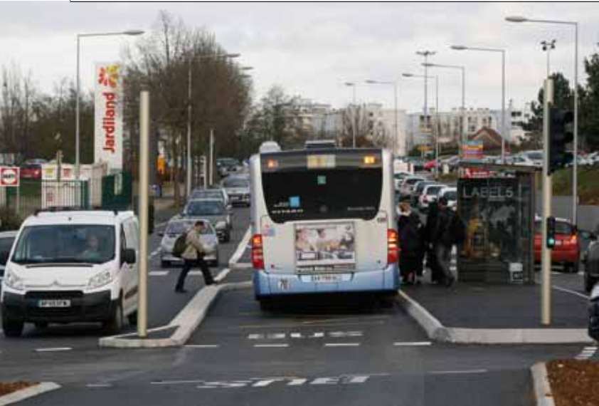
LE NOUVEAU VISAGE DE LA RUE RENÉ-CHAR. ▲

René-Char : calendrier respecté pour la livraison un mois avant les fêtes de la nouvelle artère avec, au centre, une voie de bus en site propre. Réalisés dans le cadre d'un PAE (Programme d'aménagement d'ensemble), les travaux visaient à fluidifier une circulation estimée à près de 25 000 véhicules/jour les week-ends les plus chargés. Elargie (22 m de moyenne), dotée d'un nouveau giratoire au croisement avec la rue Joachim-du-Bellay, débarrassée de ses tourne à gauche, la rue présente aujourd'hui son visage définitif après le réglage des ultimes détails (petits enrobés, terre végétale...). Au total, éclairage et feux tricolores compris, le chantier aura coûté 1,4 M€ TTC dont 80 % à la charge des enseignes ayant déposé un permis de construire et 20 % pour la Ville de Besançon.