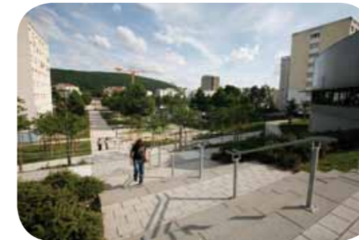
Liaison entre le centre Nelson Mandela et la place Cassin