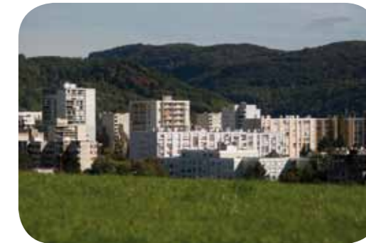
Vue de Planoise depuis les Hauts du Chazal