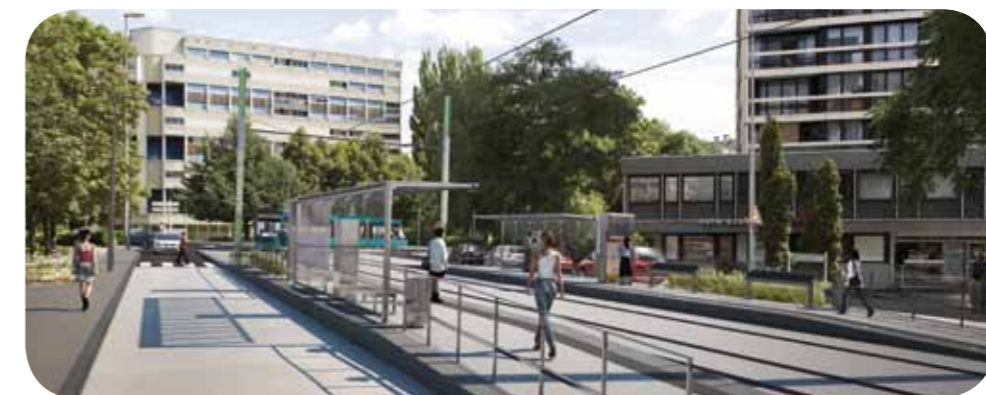
La future station Epiesses

Vous trouverez dans cette lettre d'information, toutes les astuces pour vos déplacements et les informations utiles sur le déroulement du chantier. Des médiateurs de travaux et de commerces sont également à votre disposition pour répondre à vos questions et trouver avec vous les solutions aux éventuelles difficultés que vous pourriez rencontrer durant la période du chantier.